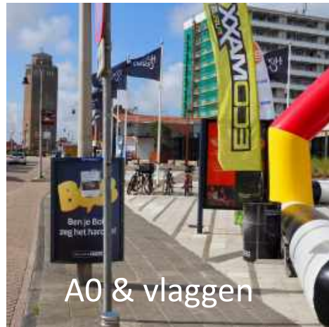
A0 & vlaggen