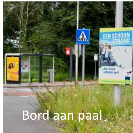
Bord aan paal